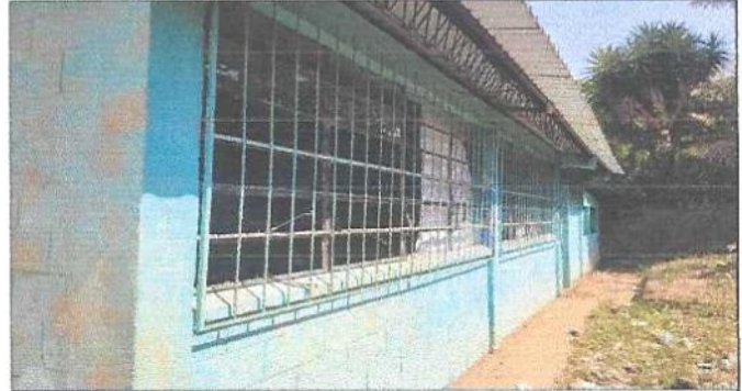
Reparacion de estructura de ventana.