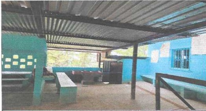
Reparacion y mantenimiento de contanera.