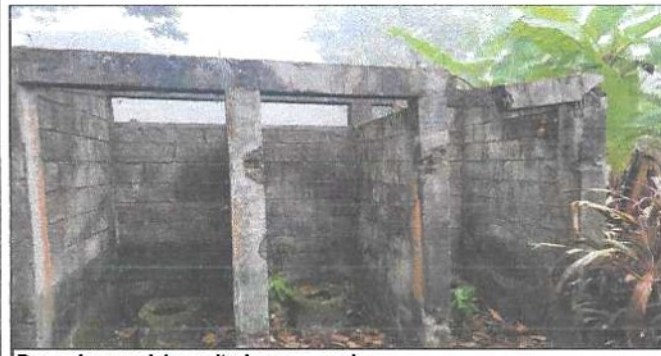
Remocion servicio sanitario y accesorio.