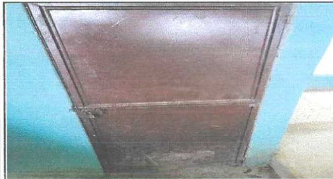
reparacion de puertas metallicas