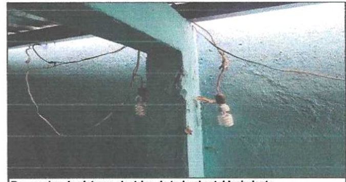
Reparacion de sistema electrico de todo el establecimiento.

Observación: Si es necesario se pueden agregar hojas adicionales y actualizar el número de hojas.