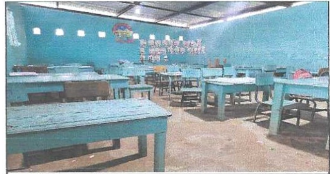
Colocacion de Piso de granito.